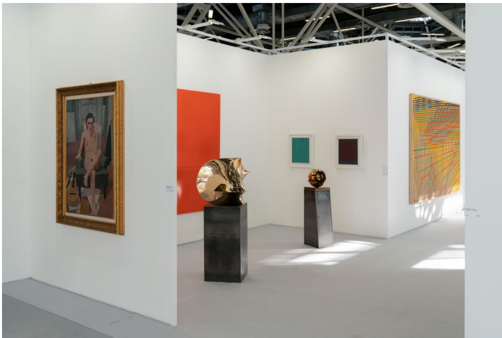
Mazzoleni ad Arte Fiera 2023.