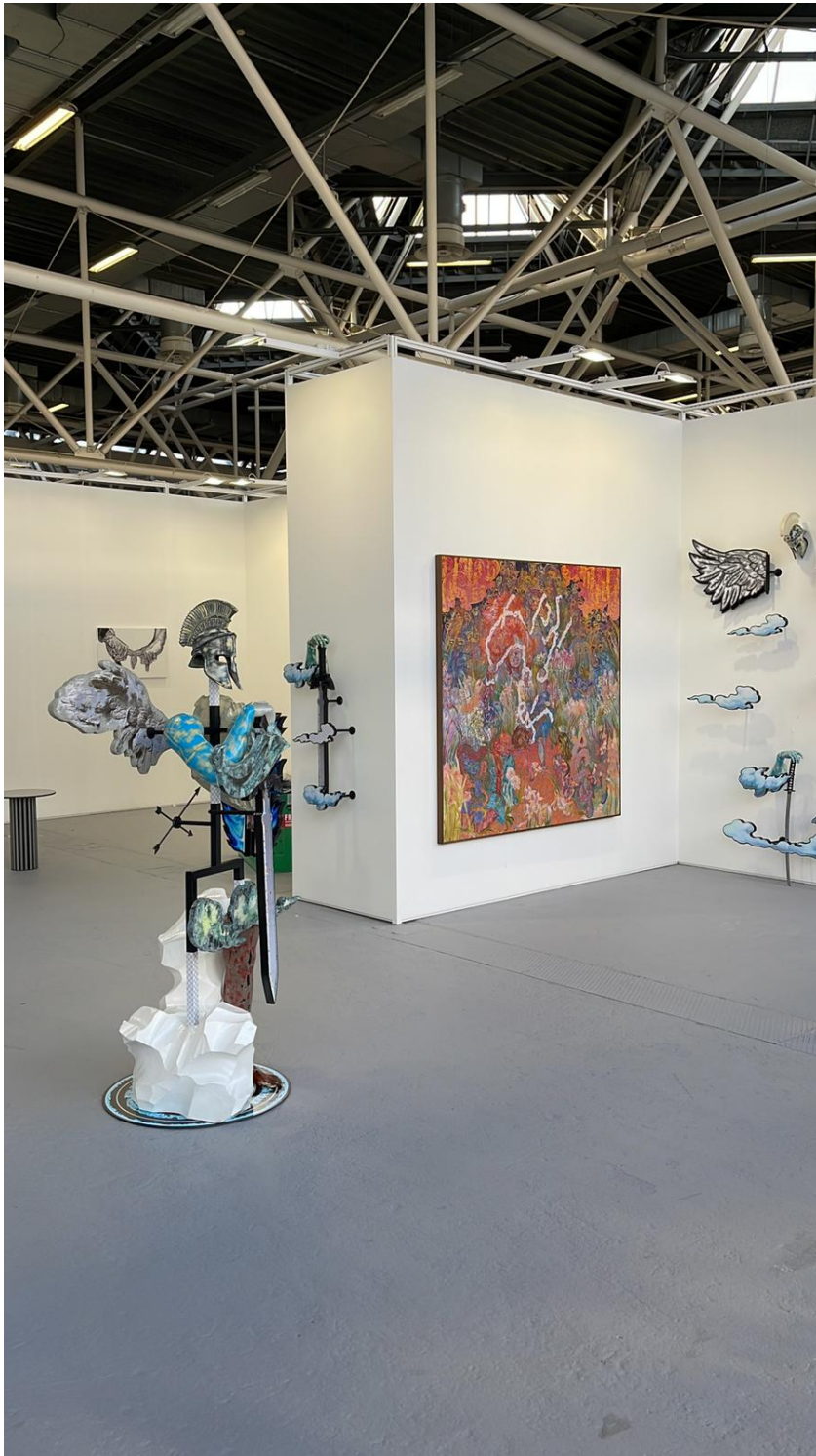
L.U.P.O. ad Arte Fiera 2023.